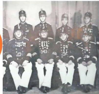
LOS PRIMEROS VOLUNTARIOS DE LA COMPAÑÍA GERMANIA.