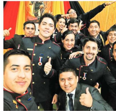
LUCIENDO LAS TENIDAS DE GALA EN EL ANIVERSARIO DE LA BOMBA.